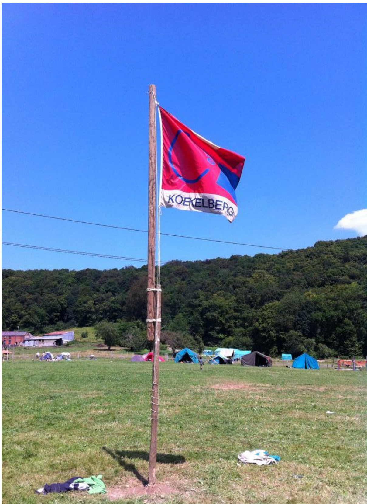
V.U.: Chiro St.-Anneke, Dapperenstraat 20, 1081 Koekelberg